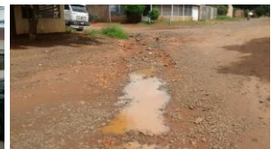
Foto 02 – Situação de via pública no Bairro Jardim Macaúbas em Campo Grande - MS.

No Bairro Chácara Cachoeira todas as ruas possuem cobertura asfáltica, iluminação pública, os pontos de ônibus possuem cobertura e as ruas são iluminadas adequadamente.