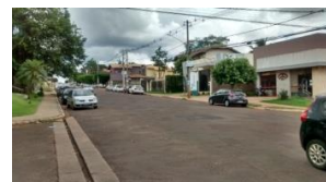
Foto 01 – Situação de via pública no Bairro Chácara Cachoeira em Campo Grande – MS.

infraestrutura urbana e o bairro com predomínio de moradores da Classe E (Região Centro-Oeste, Jardim Macaúbas), possui uma infraestrutura urbana precária, assim como pode ser observado nas Fotos 01 e 02.